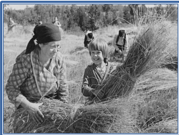
Советские колхозники в 60-е годы