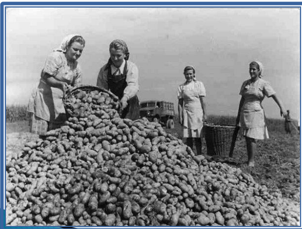
Сельское хозяйство СССР в 30-е Годы.